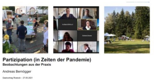
Präsentation Anlage 2